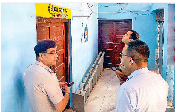
नारनौल। मतगणना स्थल का निरीक्षण करते एसपी अर्श वर्मा।

लोकसभा चुनाव की तैयारियों को लेकर व शांतिपूर्ण चुनाव संपन्न करवाने के लिए पुलिस प्रशासन लगातार सक्रिय है। पुलिस अधिकारियों की ओर से मतदान केंद्रों का निरीक्षण किया जा रहा है। इसी कड़ी में सोमवार को पुलिस अधीक्षक अर्श वर्मा ने मतगणना स्थल व ईवीएम स्ट्रांग रूम का निरीक्षण किया। इस दौरान संबंधित अधिकारियों को निर्देश दिए। एसपी ने स्ट्रांग रूम में किसी भी बाहरी व अनाधिकृत व्यक्ति के आगमन को पूर्ण रूप से प्रतिबंधित रखने के निर्देश दिए। निरीक्षण के दौरान स्ट्रांग रूम की निगरानी के लिए लगाए गए सीसीटीवी कैमरों व सुरक्षा गार्ड का निरीक्षण किया तथा सुरक्षा को लेकर सख्त निर्देश दिए।