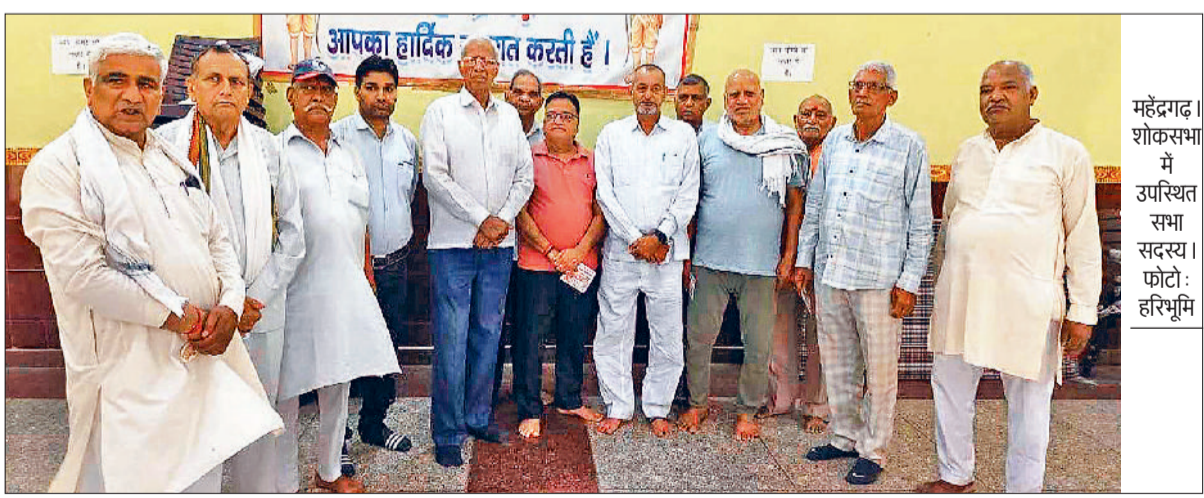
महेंद्रगढ़। शोकसभा में उपस्थित सभा सदस्य। फोटो: हरिभूमि

नारनौल। बैठक करते ब्राह्मण परिषद के सदस्य। फोटो: हरिभूमि