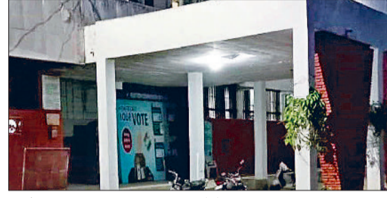
नारनौल। लघुसचिवालय भवन, फाइल फोटो।