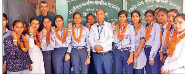
मंडी अटेली। पीएमश्री स्कूल अटेली में मेरिट छात्राओं का तिलक व फूल मालाओं से सम्मानित करते हुए।