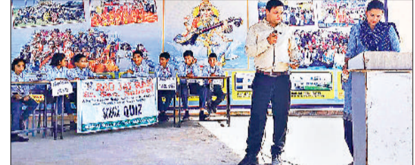
महेंद्रगढ़। प्रतियोगिता में भाग लेते विद्यार्थी।