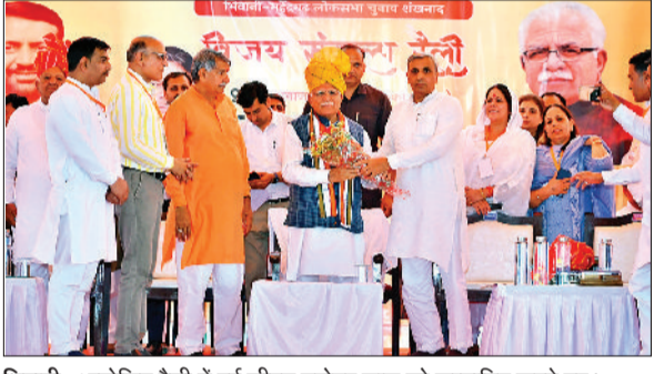
भिवानी। आयोजित रैली में पूर्व सीएम मनोहर लाल को सम्मानित करते हुए।

विजय संकल्प रैली में पूर्व मुख्यमंत्री मनोहर लाल ने कांग्रेस पर जोरदार हमला बोलते हुए कहा कि कांग्रेस के समय की कई बीमारियां हमने काटी हैं। कांग्रेस के समय में चपरासी, क्लर्क, सुपरवाइजर, एसीएच की नौकरियां पैसे देकर मिलने का आरोप लगाया। उन्होंने कहा कि हमारी सरकार ने पढ़े लिखे युवाओं को योग्यता के आधार नौकरियां दी। हरियाणा में ऐसा पहली बार हुआ गरीब परिवार के बच्चों को भी सरकारी नौकरियां मिली हैं। रैली में पूर्व मुख्यमंत्री ने कहा कि लोगों को जात-पात से ऊपर उठकर देश