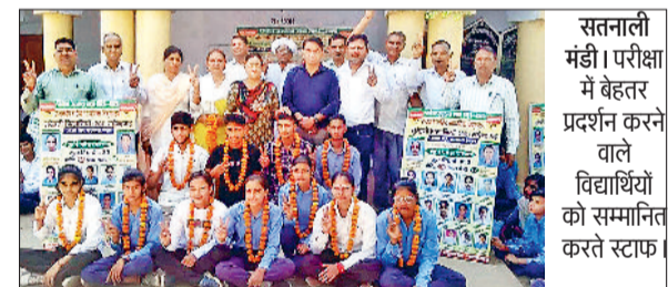
सतनाली मंडी। परीक्षा में बेहतर प्रदर्शन करने वाले विद्यार्थियों को सम्मानित करते स्टाफ।