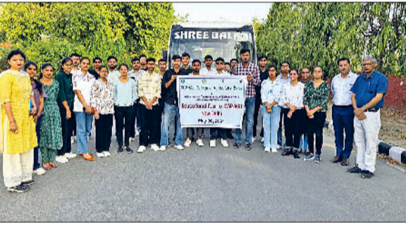
रेवाड़ी। शैक्षणिक भ्रमण के लिए रवाना होते विद्यार्थी।

वोटर्स ईसीआई.जी.ओ.वी.इन पर जाना होगा और इसमें दिख रहे सचं इन इलेक्टोरल रोल ऑप्शन पर क्लिक करना होगा। इसके बाद आपकी स्क्रीन पर एक फार्म निकलेगा। आप इसमें जरूरी डिटेल भरने के बाद सचं ऑप्शन पर क्लिक करेंगे तो आपके सामने मतदाता सूची से संबंधित आपकी जानकारी सामने आ जाएगी। साथ ही यह भी पता लग जाएगा कि आपका वोट किस मतदान केंद्र पर है। इसके अलावा आप इसी पेज पर ईपीआईसी नंबर के जरिए भी अपना नाम वोटिंग लिस्ट में चैक कर सकते हैं। यदि आपका फोन नंबर भारत चुनाव आयोग में रजिस्टर्ड है तो आप फोन नंबर डालकर भी अपना नाम देख सकते हैं।