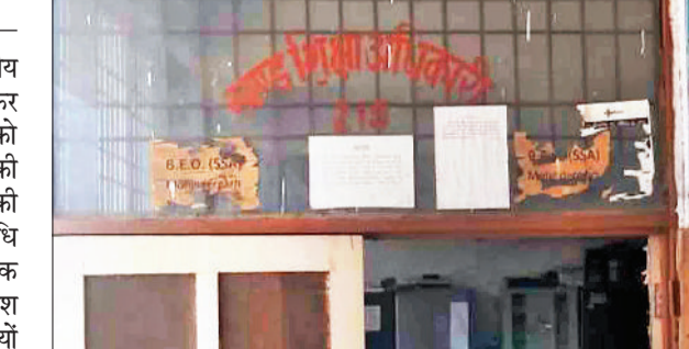
महेंद्रगढ़। खंड शिक्षा अधिकारी कार्यालय।

राज्य सरकार की ओर से राजकीय विद्यालयों के जर्जर भवन में बैठकर पढ़ाई कर रहे विद्यार्थियों को सतर्कता बरत रही हैं। सरकार की ओर से ऐसे विद्यालय बिल्टिंग की सूची मांगी है जिनकी समयावधि पूरी हो चुकी है। महानिदेशक मौलिक शिक्षा की ओर से प्रदेश जिला मौलिक शिक्षा अधिकारियों को पत्र जारी कर जर्जर भवनों की सूची मांगी गई है। बता दें कि सरकार की ओर से की ओर से हर जगह शिक्षा को प्राथमिकता दी जाती है। प्रति वर्ष