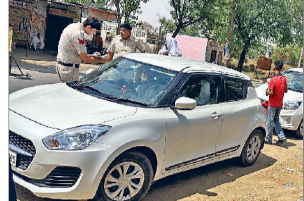
रेवाड़ी। वाहनों की जांच करते हुए पुलिसकर्मी।

वाहन चेकिंग अभियान भी चलाया जा रहा है। जिला निर्वाचन अधिकारी राहुल हुड्डा ने कहा कि जिले में मादक पदार्थ से लेकर नकदी के परिवहन को रोकने के लिए संदिग्ध वाहनों व व्यक्तियों पर