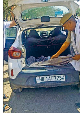
रेवाड़ी। कार की डिग्री चेक करते हुए पुलिस।

जिले में लोकसभा आम चुनाव को लेकर सघन वाहन चेकिंग अभियान चलाया जा रहा है। लोकसभा चुनाव को लेकर आदर्श चुनाव आचार संहिता की पालना सुनिश्चित करने के लिए जिला प्रशासन की ओर से सख्ती की जा रही है। चुनाव के दौरान अवैध शराब की सप्लाई व धनबल के प्रयोग सहित अन्य अवांछनीय गतिविधियों पर नजर रखते हुए जिले के बॉर्डर पर एफएसटी व एसएसटी सहित अन्य पुलिस प्रशासन की टीम सजगता से अपना दायित्व निभा रही हैं और जिला प्रशासन की ओर से पुलिस विभाग के साथ मिलकर सघन