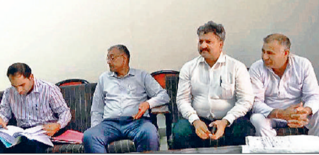
महेन्द्रगढ़। पीडब्ल्यूडी रेस्ट हाउस में जांच करते विजिलेंस अधिकारी।