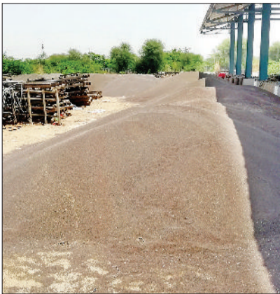
नारनौल। अनाज मंडी में बैगों में रखी सरसों व अनाज मंडी सरसों की लगी खुली ढेरियां।